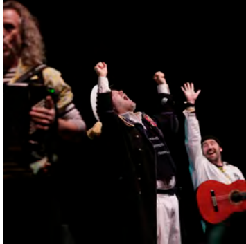
© Traffik Theater - Photo : Sébastien Grébillé